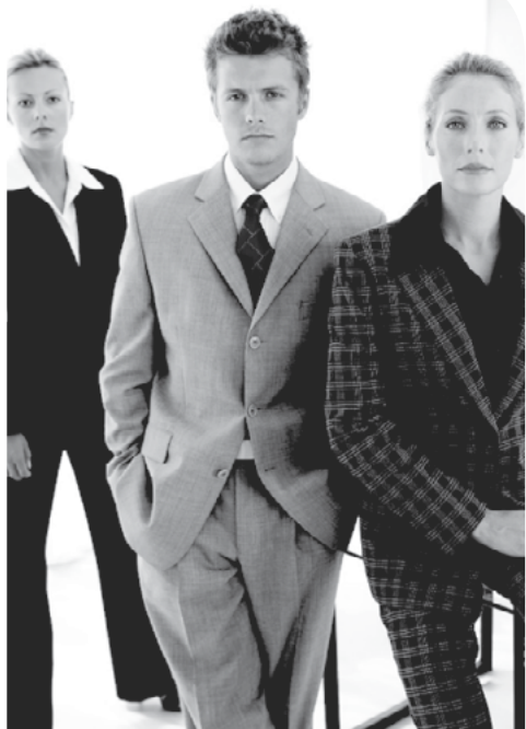
Пословни центри НСЗ