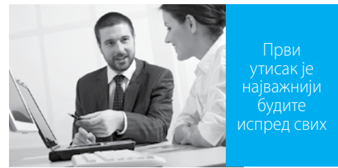
Први утисак је најважнији будите испред свих

ОСТАЛО: Као доказе о испуњености услова кандидати су обавезни да уз пријаву доставе: пријаву на оглас са кратком биографијом и наведеном адресом и контакт телефоном (по могућству и електронска адреса), оверену фотокопију дипломе о стеченој стручној спреми, оверену фотокопију уверења о положеном стручном испиту, оверену фотокопију дозволе за рад – лиценце издате од стране надлежне коморе (или решења надлежне коморе о постојању услова за издавање лиценце), оригинал или оверена фотокопија доказа о радном искуству у струци (потврде, решења, уговори или други акти којима се доказује на којим пословима, са којом стручном спремом и у ком временском периоду је стечено радно искуство), а у року од 8 дана од дана објављивања огласа у огласним новинама Националне службе за запошљавање „Послови“, на адресу: Клиничко-болнички центар „Звездара“, 11000 Београд, Димитрија Туцовића 161, са назнаком „За конкурс ради пријема у радни однос“. Неблаговремене и непотпуне пријаве на оглас неће бити узете у разматрање. Учесници у огласу писмено ће бити обавештени.