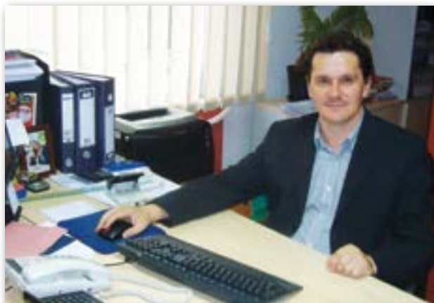
Приватно предузетништво један од главних ослонаца развоја округа

У 2015. години Филијали Зајечар из свих сектора радног ангажовања пријављено је 466 слободних радних места, што