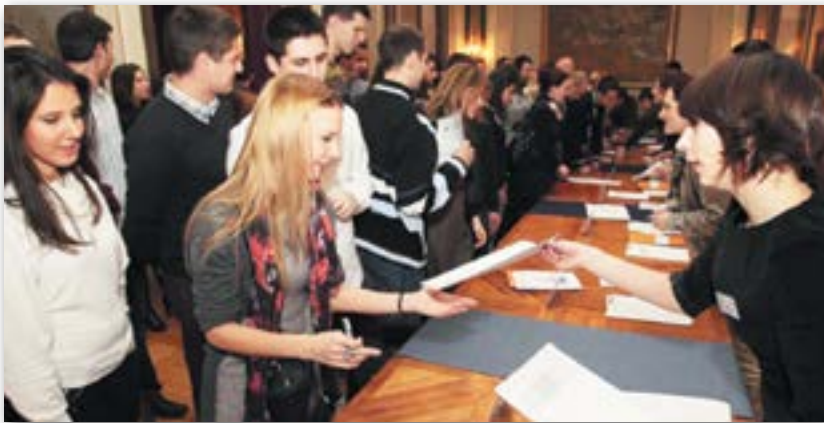
Више од 1.300 студената прошло праксу у установама града

„Више од 1.300 студената је прошло праксу у установама града, а само од јула ове године 150, од којих ће неки бити на пракси до краја године. Планирамо да у наредном периоду повећамо број студената у овом програму, али и број институција. Хоћемо да што већем броју младих људи дамо шансу да, осим